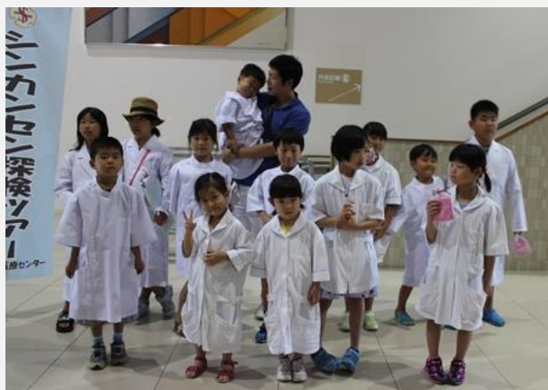
参加のみなさん お疲れ様でした。