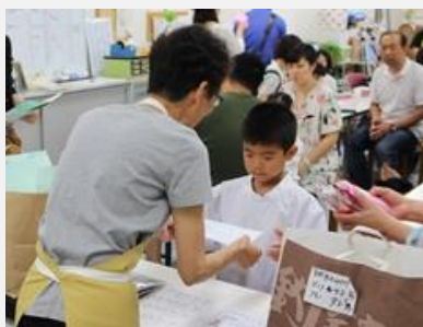
認定証、参加記念品を参加者に渡しました。