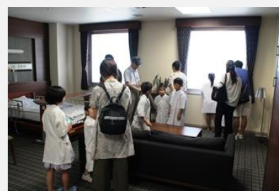
5階の特別室を見学しました。関門海峡が良く見えましたね。