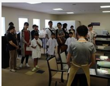
白衣に着替え、準備万端です。