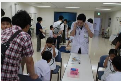
研修医の指導で診察体験、心臓マッサージ、AEDの体験