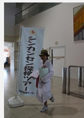
600人目になりました。

平成23年7月から開始したコンシェルジュツアーは今回で、参加者は609人となりました。なお、今後は定期開催を中止しますが、団体等でご要望があれば開催しますので、病院までご連絡ください。(電話:083-241-1199)