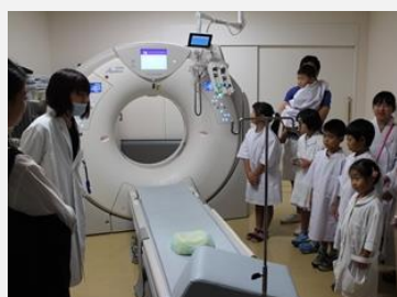
CT室で放射線技師から説明を聞きます。