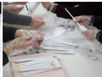
みんなで箸袋に箸を入れます