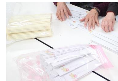
台紙を折って箸袋を作ります