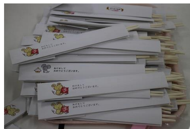
完成した干支の箸袋