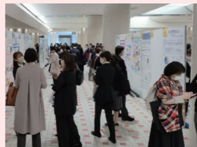
駅のオープンスペースで行われたポスター発表の様子

私は学会2日目に「当センタ―における虫垂炎の治療方針」について発表し、ありがたいことにベスト口演賞をいただきました。これまでのチームの努力が評価されたことを嬉しく思うとともに、今後の励みとなりました。 ちやうどカニ漁が解禁された直後でもあり、学会会間に立ち寄った近江町市場には新鮮なカニが並び、冬の訪れを感じる光景も印象的でした。今回の第80回国立病院総合医学会は横浜で開催予定です。今回得た多くの刺激と学びを糧に、今後も臨床・研究・病院運営の三位一体での発展に努めたいと思います。