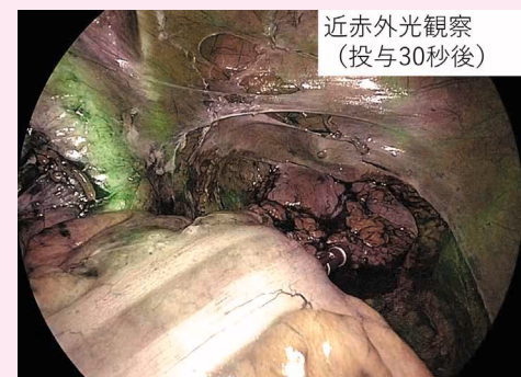
近赤外光観察 (投与30秒後)