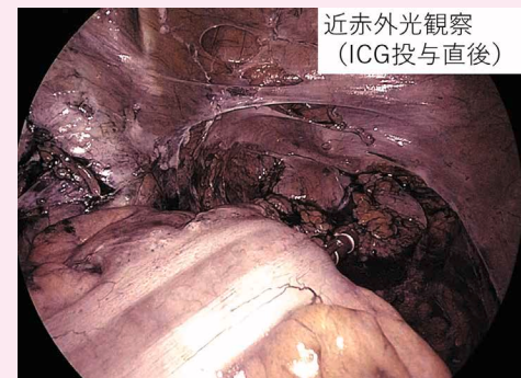
近赤外光観察 (ICG投与直後)