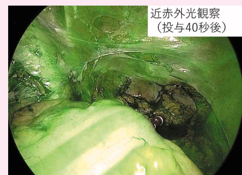
近赤外光観察 (投与40秒後)