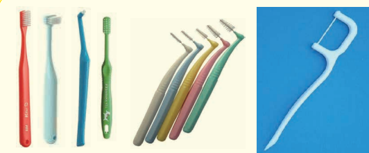
左より普通の歯ブラシ、部分磨き用歯ブラシ、ダブルブラシ、小児用歯ブラシのサイズがよいでしょう。様々なサイズの歯間ブラシがあり、通常はSSSのサイズがよいでしょう。糸ようじ(フロス)にも様々な種類があります。