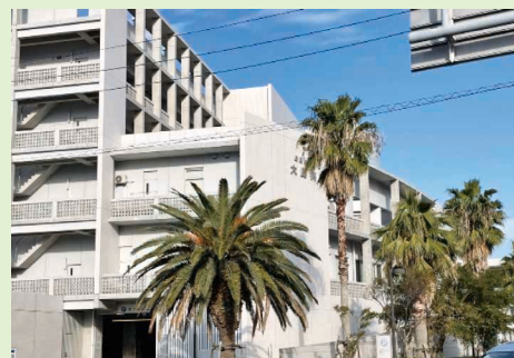
周防大島町立病院にて

この度は周防大島町立病院にて地域研修をさせていただきました。周防大島町は人口約150000人、高齢者率約55%と下関市よりも遙かに進んだ高齢化社会です。ですので、生活習慣病や高齢者介護などの問題に深く触れることができました。1カ月でした。高齢者介護につきましても依然問題は山積ですが、ケアマネージャーなどによる実態の把握・施設増設などが徐々に進んでいく