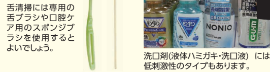
舌清掃には専用の舌ブラシや口腔ケア用のスポンジブラシを使用するとよいでしょう。洗口剤(液体ハミガキ・洗口液)には低刺激性のタイプもあります。

【歯磨き舌清掃の回数方法等について】 歯磨き舌清掃は基本的には毎食後と寝る前の1日4回行って頂くことがベストですが、体調不良時や時間がない