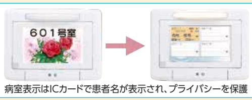
病室表示はICカードで患者名が表示され、プライバシーを保護