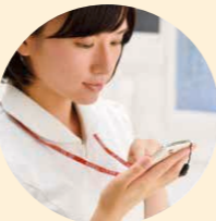
スマートフォン操作で対応します