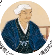
福岡県とかかわりの深い黒田如水