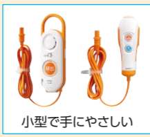
小型で手にやさしい