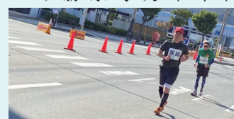
今年も完走しました

3回目のドクターランナー 関見台公園の木々も赤黄色に色づき始め、病院の窓からも秋の訪れを感じる季節となりました。 新型コロナウイルスの影響により昨年中止となりました。下関海響マラソンが、今年は十分な感染対策のもと開催されることが決定しました。出走するランナーの数も例年の10000人から半分の5000人規模へ縮小され、事前にランナー全員に抗原検査が行われるなど、例年とは異なる様式での開催となりました。そんな中、わたくしたちドクターランナーにも今年は大きな変革がありました。それは今年からドクターランナーに加え、新たにナースランナーも出走することです。そのおかげで今年はさらにパワーアップしたチーム関門として、参加された市民ランナーの皆様をバックアップすることになりました。