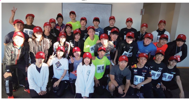
出走前に全員で気合を入れて記念撮影