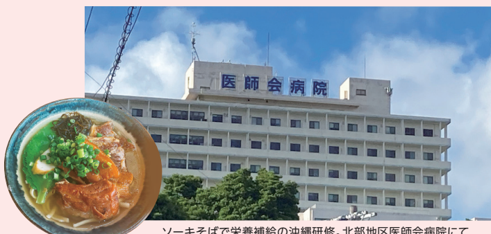
ソーキそばで栄養補給の沖縄研修。北部地区医師会病院にて

集まっております。COPD、急性増悪といった救急対応から肺癌stageⅣのターミナルケアまで幅広い疾患を経験することができました。また、この1ヶ月で気管支鏡検査や胸腔穿刺などの手技を見学、経験させていただいたり、呼吸器科では治療にステロイドが登場することが多く、ステロイドによる副作用や日和見感染予防についても勉強することができました。山口に帰ってからもここで得た知識、経験を生かして自身の研修病院に少しでも還元できたらと思います。