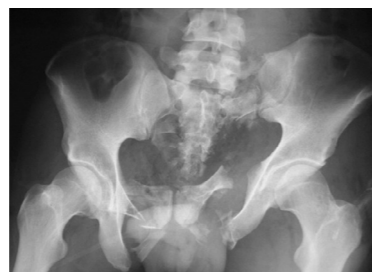
不安定型骨盤骨折

た各医療職の方々の支えで成り立っております。1日でも早く、多くの方に救急医療で貢献出来るよう、精一杯頑張りますので何卒宜しくお願い致します。