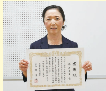
下関消防局中央消防署にて