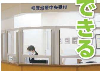
【ソーシャルディスタンス】 飛沫防止用パーテーションの設置や、足形の配置で、人との間隔をとるように徹底しています。多言語対応の表示も行っています。