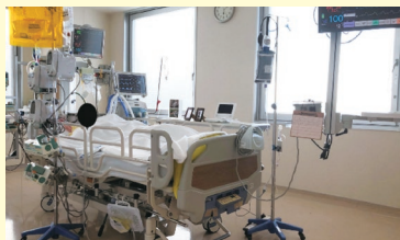
<明るく開放感のある個室> 窓からは開門海峡が一望できます。ベッドサイドには家族写真やその日の出来事が書かれた日記が置かれています。

となり、また、ご家族と共有できるようにしています。一層強くなつていくように治療中の苦痛を最小限に抑え、集中治療後に患者さんご家族が早く元の生活に戻れるようスタッフ全員でサポートしています。