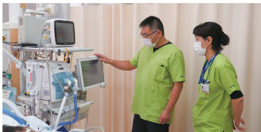
人工呼吸器の設定を確認

高齢化社会、医師の労働条件の改善など様々な社会情勢や医療・福祉を取り囲む問題に対して特定行為看護師制度は2017年10月よりスタートしました。政府は2025年までに10万人の特定行為看護師の育成を目標としており、現在は全国で266名、下関市には約20名が活動しています。私は2019年3月に看護師として認定行為研修を修了し、2019年9月より当センターで特定行為看護師としてICUや救命センター、急性期病棟で主に人工呼吸器を装着した患者さんの看護にあたっています。当センターには特定行為認定看護師が私を含め2名います。特定行為認定看護師の活動をはじめ1年が経過しました。人工呼吸器を装着した患者さんは重症な状態であり、数日間の安静が強いられることがほとんどです。看護師の立場から、早期に人工呼吸器を外せるように、病態をアシメントし、患者さんの日頃の生活の状況をご家族や前施設から情報収集し、人工呼吸器の