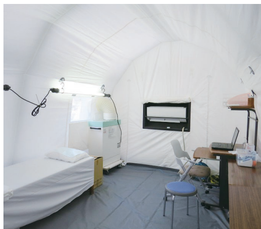
【発熱外来用テントの設置】 発熱外来を設置し、館内に入らずに診療・検査を受けることができます。