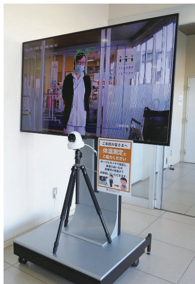
【検温・消毒・問診の徹底】 出入口を制限し、検温・消毒・問診の徹底に努めています。救急対応の診察には、大型空気清浄機を導入して、換気にも配慮しています。