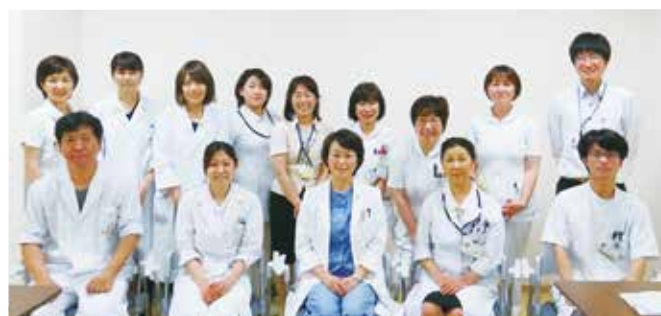
チームで患者さんを支えます

診療以外にも、次のような活動を行っています。 ① 乳癌化学療法カンファレンス…術前術後の抗がん剤治療、再発転移乳癌に対する抗がん剤治療など、毎日多くの患者さんが抗がん剤治療を受けられます。がん化学療法認定看護師、がん薬物療法認定薬剤師を中心に、定期的にカンファレンスを行っています。 ② 院内勉強会…多職種が互いの知識や技術を教え合います。教えることで自分の知識の確認、向上につながります。今後は乳腺センターのスタッフだけでなく、オープンな勉強会にしたいと考えています。 ③ 学会発表…医師だけでなく、看護師や検査技師も積極的に学会発表をし、最先端の知識や技術を取り入れようと頑張っています。 ④ 年に2回の親睦会…2017年度は8月に